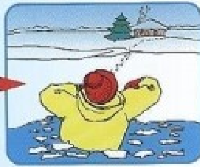
Выбраться в сторону, с которой произошло падение