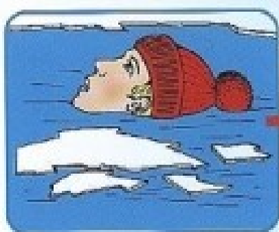
Не погружаться в воду с головой