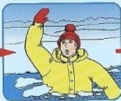
Не паниковать, позвать на помощь