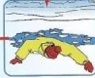
Налезшая на лед, раскинуть руки в стороны