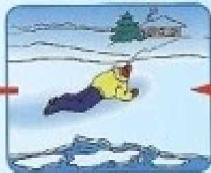
Проползти 3-4 метра по своим следам