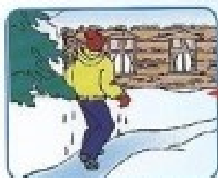
Не отдыхать, бежать в сторону здания